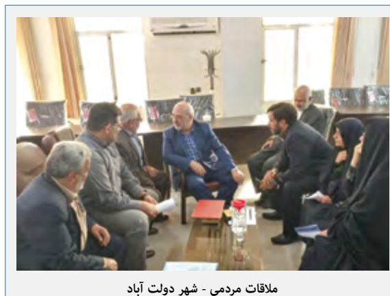
ملاقات مردمی - شهر دولت آباد