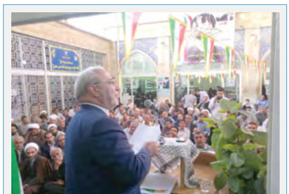
تشریح مسائل کشور در مسجد جامع زرین شهر