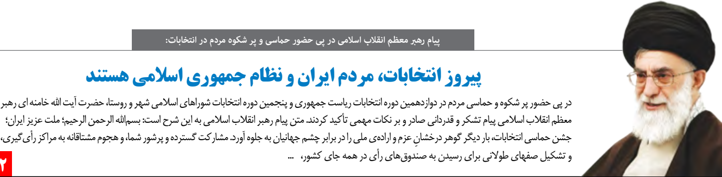
پیام رهبر معظم انقلاب اسلامی در پی حضور حماسی و پر شکوه مردم در انتخابات: