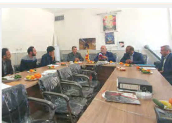
جلسه رفع مشکلات حوزه کشاورزی - بخش وزوان

گوشه ای از فعالیت های آقای حاجی در اردیبهشت