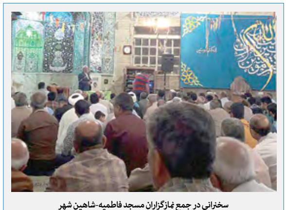
سخنرانی در جمع نمازگزاران مسجد فاطمیه-شاهین شهر