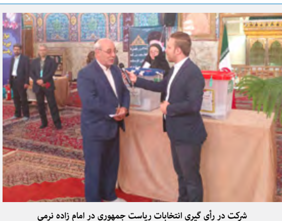
شرکت در رأی گیری انتخابات ریاست جمهوری در امام زاده نرمی