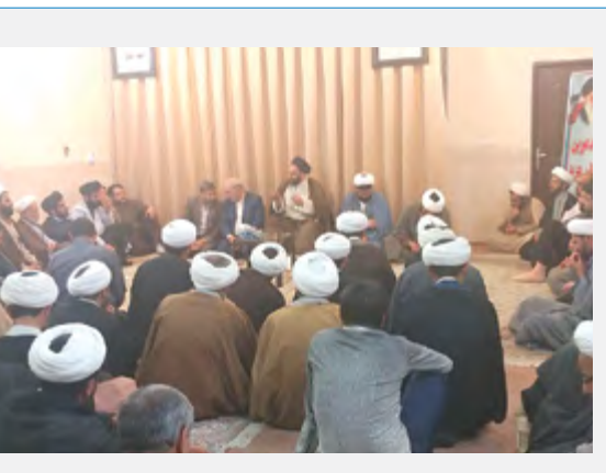
ملاقات مردمی - بخش میمه