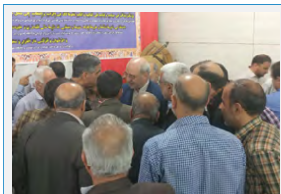
حضور در جمع نمازگزاران مسجد امام سجاد-آتشگاه اصفهان