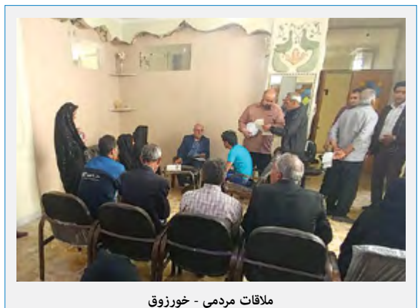
ملاقات مردمی - خوزروق