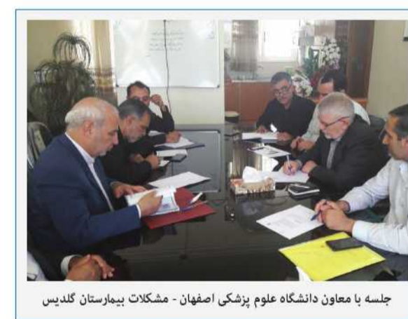
جلسه با معاون دانشگاه علوم پزشکی اصفهان - مشکلات بیمارستان گلدیس