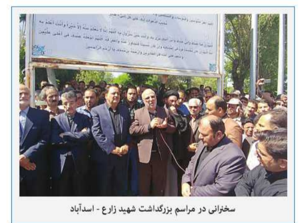
سخنرانی در مراسم بزرگداشت شهید زارع - اسداباد