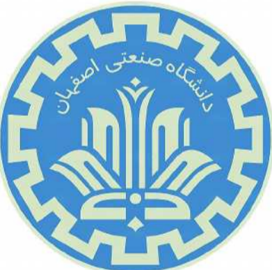
فولادگر در جمع اصحاب رسانه عنوان کرد :

براساس گزارش پایگاه استنادی علوم جهان اسلام (ISC)، دانشگاه صنعتی اصفهان با بیشترین مقالات یک درصد برتر، جایگاه نخست در میان دانشگاه های صنعتی و عنوان دومین دانشگاه کشور را به خود اختصاص داده است. مقالات یک درصد برتر شامل تنها یک درصد از مقالاتی است که در مجلات ISI منتشر می شود، هر چند آن ها یک درصد از مقالات دنیا را تشکیل می دهد، ۱۸ درصد از استنادهای آن را دریافت می کنند که تعداد استنادهای دریافتی مقالات، جایگاه آن ها را در شبکه علم در سطح بین المللی را مشخص می نماید. استنادها به معنی میزان استفاده از