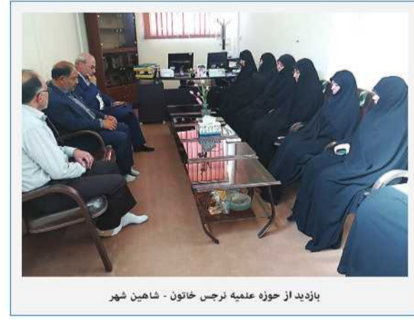
بازدید از حوزه عنقه نرجس خاتون - شاین شهر