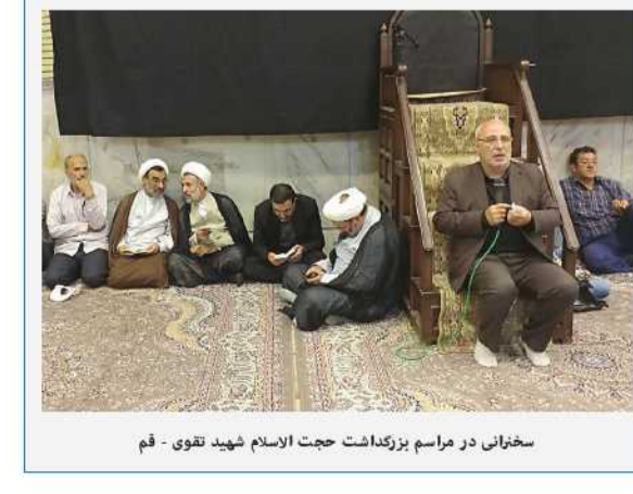
سخنرانی در مراسم بزرگداشت حجت الاسلام شهید تقوی - قم