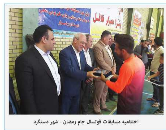
اختتامیه مسابقات فوتسال جام رمضان - شهر دستگرد