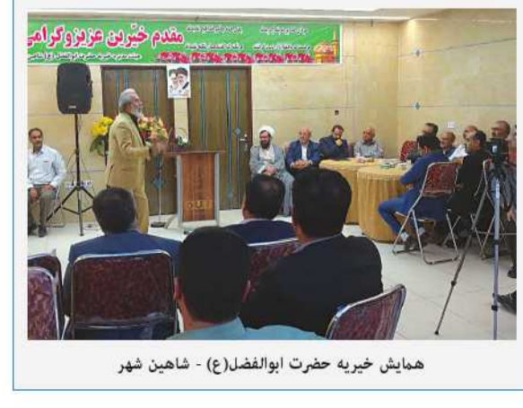
همایش خیریه حضرت ابوالفضل(ع) - شاین شهر