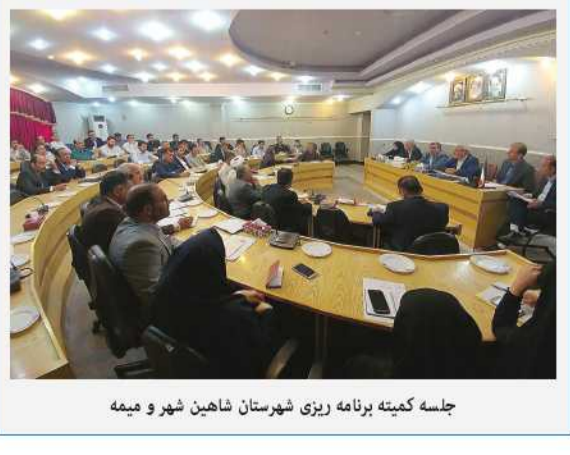
جلسه کمیته برنامه ریزی شهرستان شاین شهر و میمه