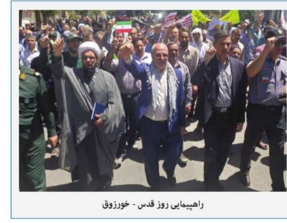
راهپیمایی روز قدس - خوززوق