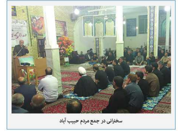
سخنرانی در جمع مردم حبیب آباد