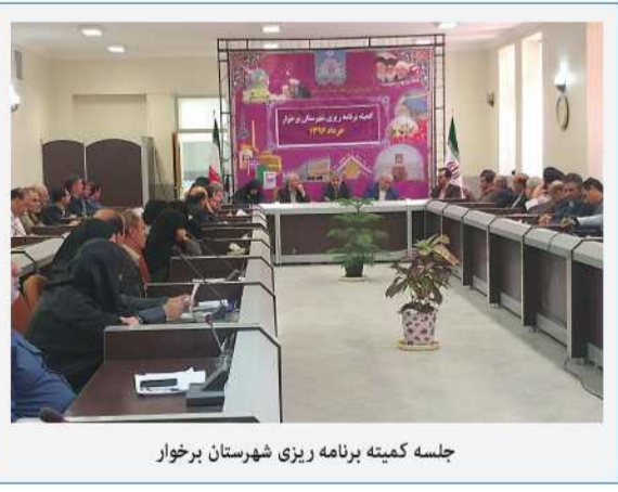
جلسه کمیته برنامه ریزی شهرستان برخوار