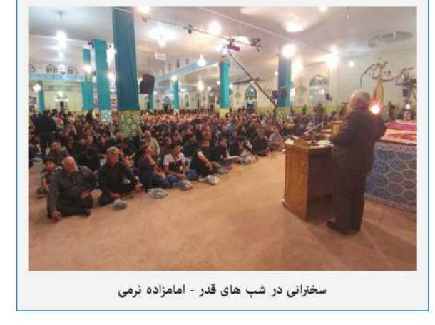
سخنرانی در شب های قدر - امامزاده نرمی